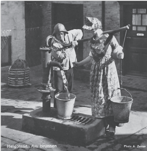
Helgoland, Am Brunnen

Temperatur max 1 °C rel. Luftfeuchte 90 % Wind aus NW 24 km/h Luftdruck 1011 hPa HW 02.02 Uhr + 14.19 Uhr NW 08.47 Uhr + 21.08 Uhr Sonnenaufgang: 05.32 Uhr Sonnenuntergang: 21.17 Uhr