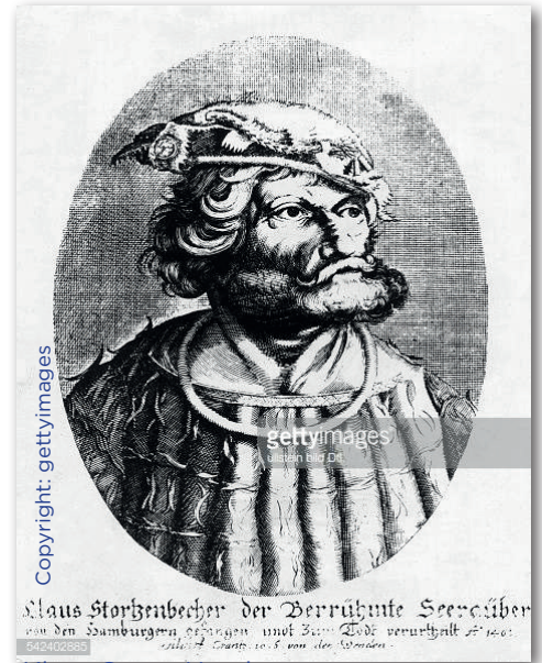
Klaus Störtebeker der berühmte Seeräuber von den Hamburgern gefangen und zum Tode verurteilt 1401. Quelle: J. G. Schöner, 1868, von der Wiedener Klaus S. aus Hamburg

Auf unserem Themenweg „ Kanten und Linien auf der Spur “, Helgolands Architekturweg, erfahren Sie wie Helgoland ab 1952 zu seinem neuen Gesicht kam und die verschiedenen Funktionsbereiche (Wohnen, Tourismus und Gewerbe) Einfluss auf die Neubebauung nahm. Die kubisch-knappe Formensprache der neuen Helgoländer Häuser wurde und wird vom Gedankengut des Bauhauses beeinflusst. Sie erfahren, wie abwechselnde und leicht gebogene Straßenverläufe und verspringte Häuserfluchten für Abwechslung sorgen.